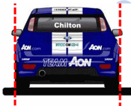
Figur 3 Karossens silhouettelinjer