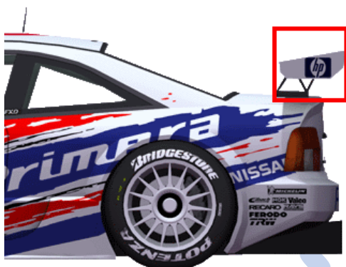
Figur 2 Box 20x20 cm